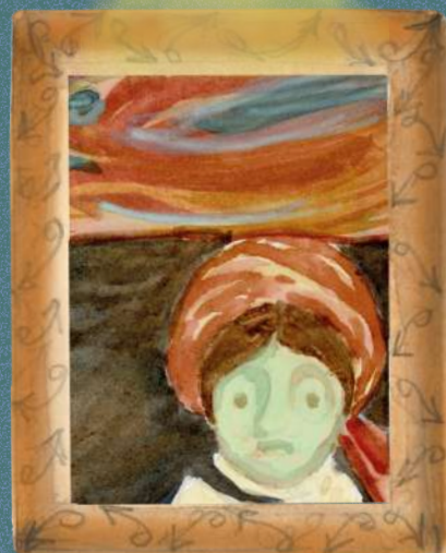
EDVARD MUNCH 1894 SKETCH OF A HEAD