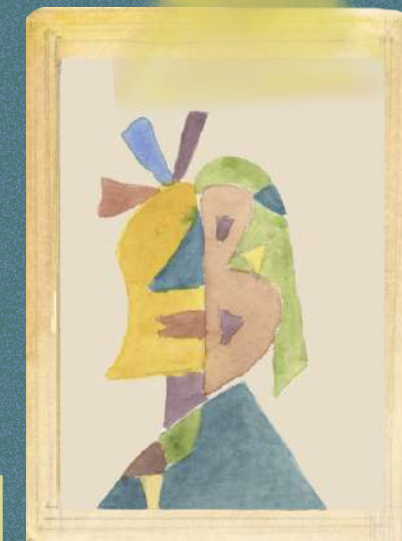
UMBERTO BOCCIONI 1911 PORTRAIT OF A WOMAN