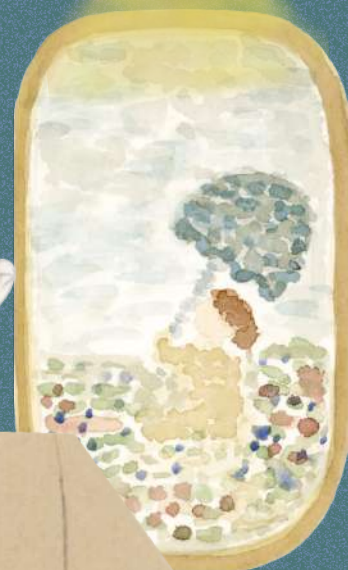
CLAUDE MONET 1875 PORTRAIT OF A WOMAN